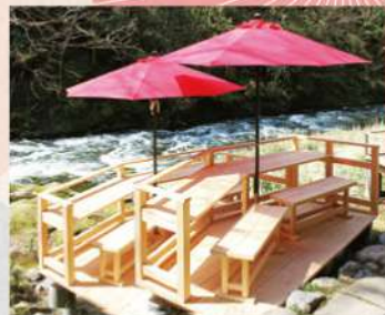
お座敷だけでなく、ベアシートもあります。

北陸随一の渓谷美を誇る 鶴仙溪に、名物の「川床」が 今年もお目見え。 清らかな川のせせらぎを 聞きながら、 風情あるひとときを お過ごしください。